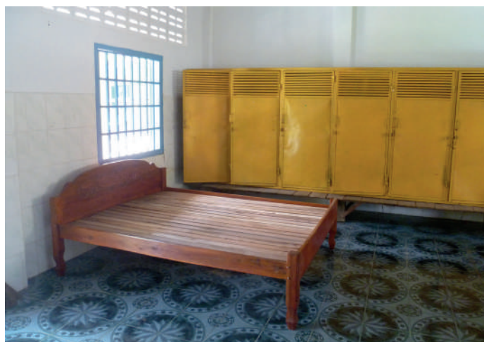
Rénovation de l'internat des garçons