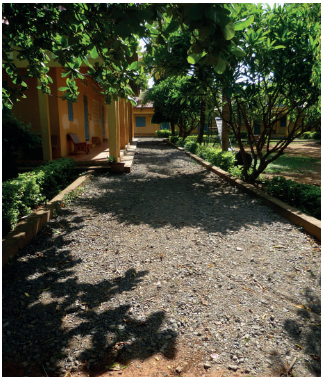
Rénovation des allées