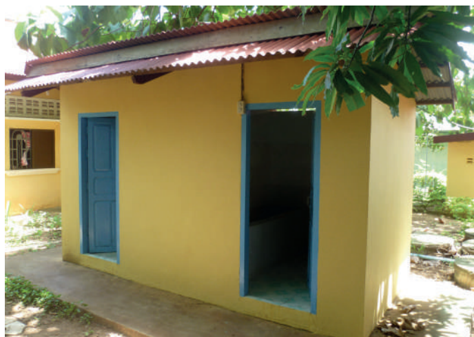
Nouveau bloc de toilettes