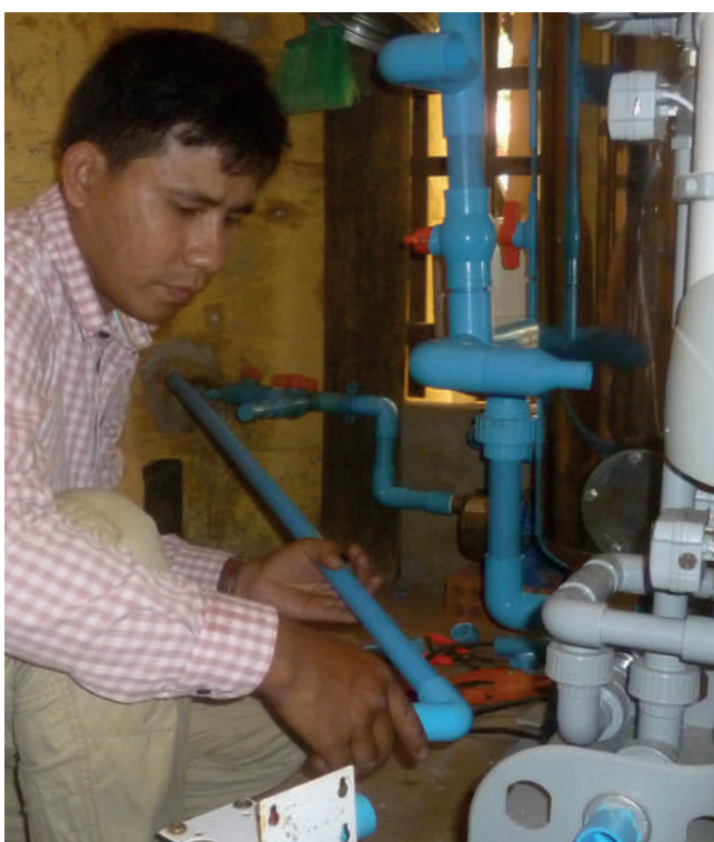
Rénovation du système de potabilisation de l'eau