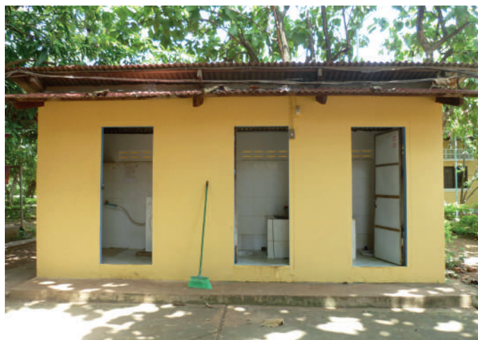
Rénovation de trois sanitaires