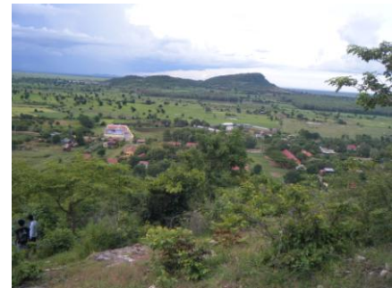
Foyer Lataste, village de Khla Kaun Tmei

Notre association se développe au fur et à mesure de l'évolution des besoins sur place. Nous adaptons nos programmes à la situation locale et nationale, au développement des enfants que nous suivons.