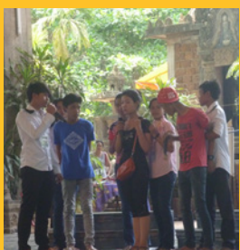
Début 2014 : Pièce de théâtre de sensibilisation aux violences domestiques mise en scène par un professeur du CSS.