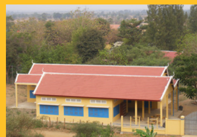
2015 à 2017 : mois d'octobre dédié à la multiplication des supports de pédagogies alternatives et à l'individualisation du soutien scolaire.