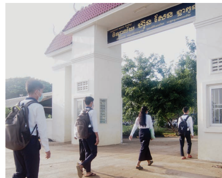
Les jeunes du Foyer ont repris le chemin de l'école le 7 septembre 2020 et entament leur deuxième semestre.

Les plus petits, des grades 1 à 6, ont retrouvé leurs camarades à l'école primaire. De façon alternée, les classes de CP, CE1 et 6 ème (grades 1,2 et 6) se rendent à l'école 3h par jour du lundi au mercredi. Pour les classes CE2, CM1 et CM2 (grades 3,4 et 5), ils y vont du jeudi au samedi.