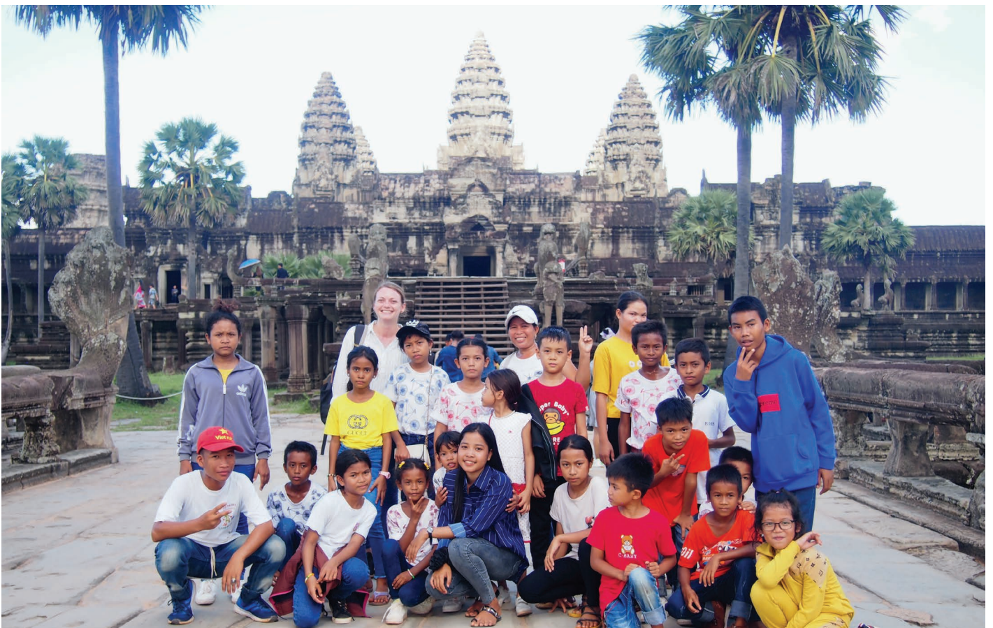
Sortie du Nouvel an Khmer à Siem Reap

01 octobre : Début des cours d'anglais renforcés par Haly, professeur d'anglais khmer volontaire au Foyer