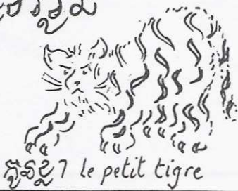
ក្នុងខ្សែ 1 le petit tigre

Bulletin d'information du Foyer d'atâte de KHLA KON Chmei Sisophon Bantey Meanchey Royaume du Cambodge le 16 Avril 2001