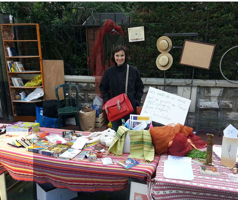
Au milieu de mon bric-à-brac, quelques Petit Tigre et un panneau qui dit : «Les ventes de ce stand sont au profit de l'asso AEC Lataste, foyer d'enfants au Cambodge»