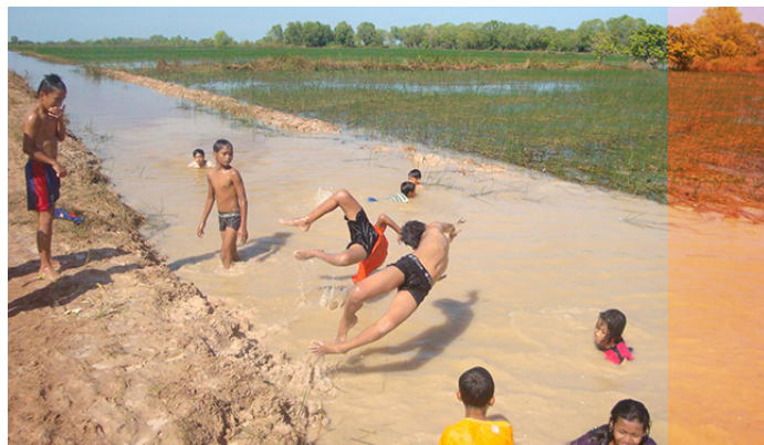
Les enfants s'en sont donné à coeur joie lors de la sortie pour la fête de la lune

Du 16 au 18 : Fête de la lune au foyer, dîner dansant, cérémonies et sortie à la rizière.