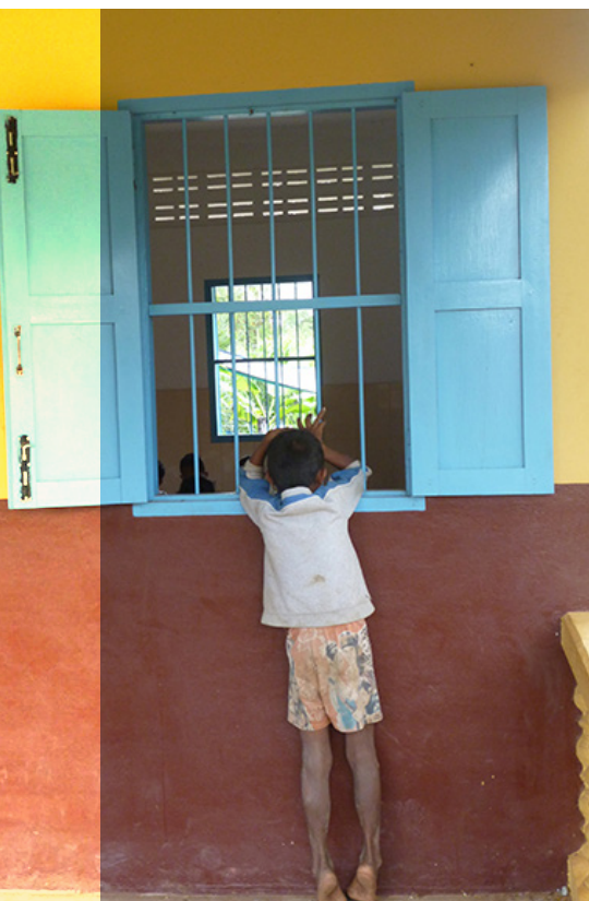
Nous devons réussir à mieux cibler les enfants les plus dans le besoin : enfants déscolarisés, enfants qui travaillent, etc...

EN 2014 NOUS NE PRÉVOYONS PAS DE DÉVELOPPEMENTS RÉVOLUTIONNAIRES DE NOS PROGRAMMES, MAIS COMME TOUJOURS UNE EXTENSION MODESTE DE NOS ACTIVITÉS, À L'ÉCHELLE DE NOTRE PETITE ASSOCIATION. AVEC BIEN EN TÊTE NOTRE PHILOSOPHIE : OFFRIR UN VRAI SOUTIEN DE LONG TERME À CEUX QUI EN ONT LE PLUS BESOIN, SANS CRÉER DE PRIVILÈGES NI D'ASSISTANAT, DANS LE RESPECT DE LA CULTURE LOCALE.