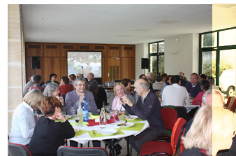
Un beau dimanche à Gouvieux

Comme nous vous en parlons dans le précédent Petit Tigre, un déjeuner a été organisé le 1 er décembre à la salle municipale de Gouvieux (Picardie), par les membres du conseil d'administration de l'AEC-Lataste. Au menu : projection de vidéos et photos, exposition et stand d'artisanat ont permis à chacun de s'informer et d'échanger dans un cadre convivial. En tout ce sont 50 personnes, parrains-marraines, sympathisants et amis qui se sont retrouvés autour du repas et des animations, permettant de récolter près de 3 000 euros.