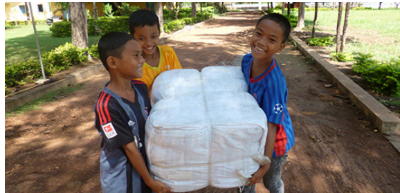
A gauche: Les habitants de la province s'organisent lors des inondations A droite: Distribution de "kits d'urgence" aux familles des FI

LA PROVINCE DU BANTEAY MEANCHEY OÙ TRAVAILLE L'AEC-LATASTE, A ÉTÉ TOUCHÉE EN OCTOBRE 2013 PAR DES INONDATIONS TRÈS IMPORTANTES. DANS LES VILLAGES OÙ NOUS SOUTENONS DES ENFANTS, UN GRAND NOMBRE DE FAMILLES ONT DÛ ABANDONNER LEURS MAISONS INONDÉES ET S'INSTALLER AU SEC AU BORD DES ROUTES, SOUS DES ABRIS DE FORTUNE.