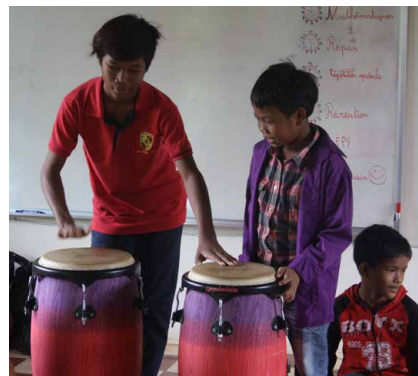
Ci-dessous : Nos jeunes s'initient aux tambours et aux percussions!