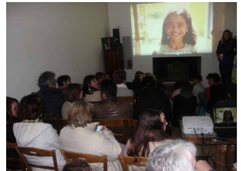
Projection-débat du film de l'association.