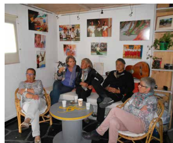
Plusieurs membres de l'AEC devant l'exposition l'«Art au Foyer Lataste».

Le 4 juin 2016, la Haute Savoie a accueilli l'Assemblée Générale (AG) de l'Association AEC-Foyer Lataste. La Haute Savoie est un département qui rassemble de nombreux parrains et marraines de longue date de notre association et où l'AG a lieu tous les deux ans.