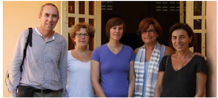
Visite d'une délégation de Monireth au Foyer, en décembre 2015.

L'action de Monireth comporte également un volet formation professionnelle, sujet d'éducation désormais essentiel au Cambodge. Depuis plusieurs années Monireth soutient des formations de couturières dispensées par l'Association AFEC auprès de jeunes femmes issues de villages très pauvres, formations leur permettant d'acquérir en 3 mois un métier et de gagner ainsi leur vie. En outre