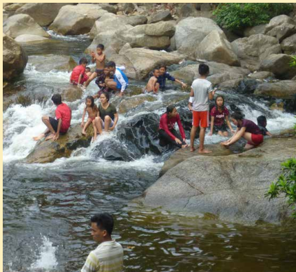
Ci-dessus et à droite : Baignades le 7 et le 8 avril, dans les jolies cascades de Chrok La-eang.