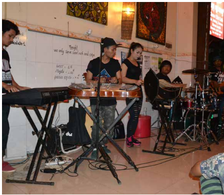
Ci-dessus : le groupe de musiciens au Choco l'Art Café, en pleine représentation.