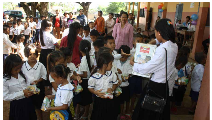
Ci-dessus : Distribution des encas et des boissons par les plus grands.