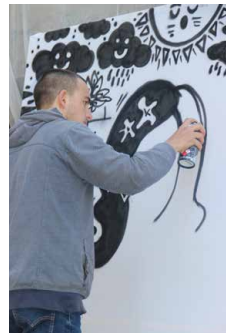
Performance de Brieux.