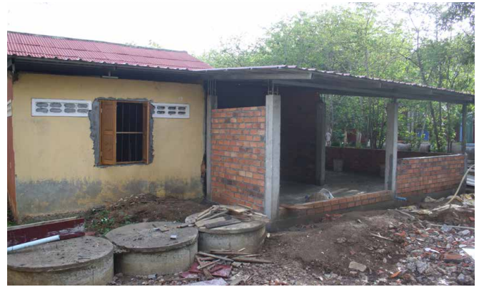
Aménagement de l'espace cuisine (ci dessus) et construction de la terrasse (ci-dessous).

UN GRAND MERCI À LA FONDATION HÉLOÏSE CHARRUAU POUR SON SOUTIEN!