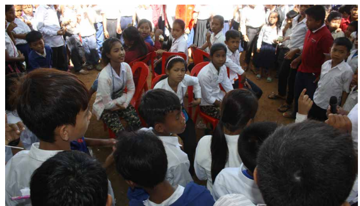
Ci-dessus : Jeu des chaises musicales après la pause goûter et les petites pièces de théâtre.

Ci-contre : Un des dessins affichés dans la cour de récréation. Il illustre le droit de vivre dans un milieu convivial et le droit d'avoir une famille.