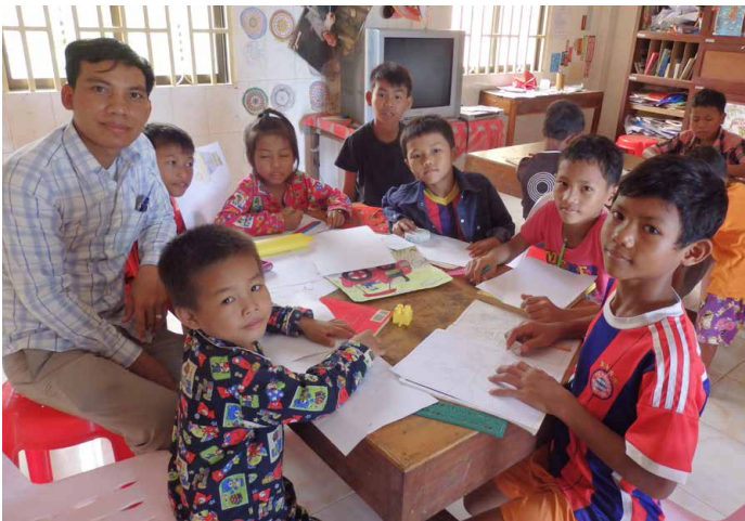
Propos recueillis par Charlotte Perrin

Séance d'écriture avec une partie des enfants qui participent à l'échange, accompagnés par Syronn, salarié du Foyer Lataste.