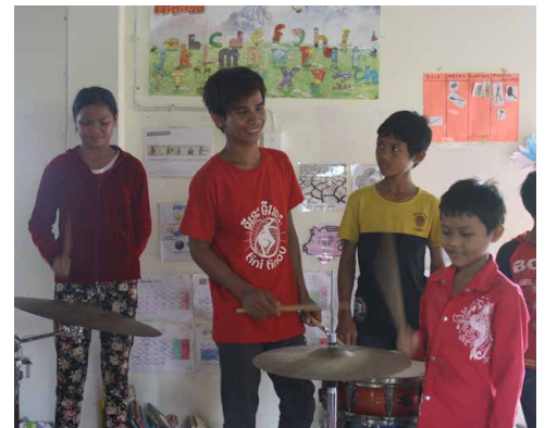
Ci-dessus : Maintenant les symbales, pas facile de rester dans le rythme...