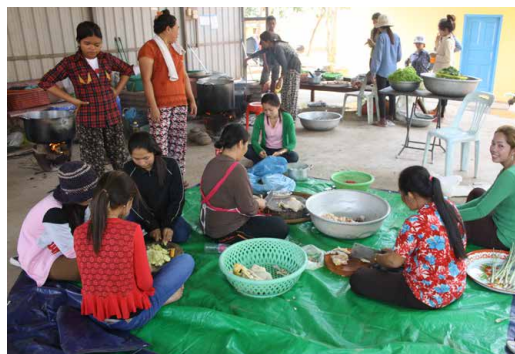
Ci-dessus : Préparation du repas.