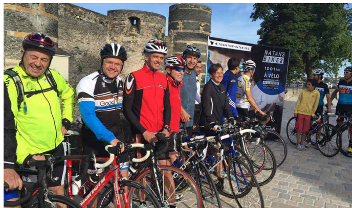
Participants à la «Natan's bike 2», lors de l'étape de Brétignolles sur mer - La Rochelle