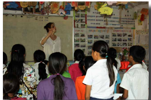
Atelier chant mené à l’école Somras Komar