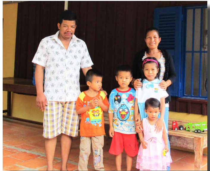
La 3ème Maison Familiale au complet

(Rires) L'ambiance est très sympa. Ma grande sœur et ses enfants passent souvent ici et vice-versa. Je suis heureuse de vivre près d'elle.