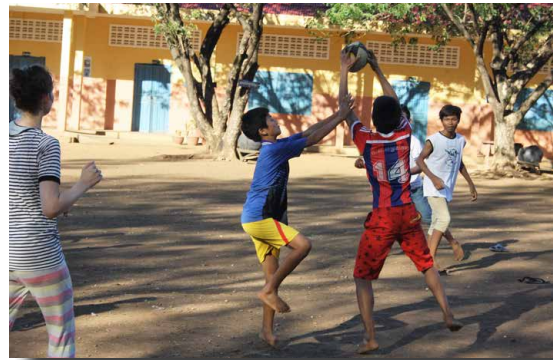
← Séance de rugby