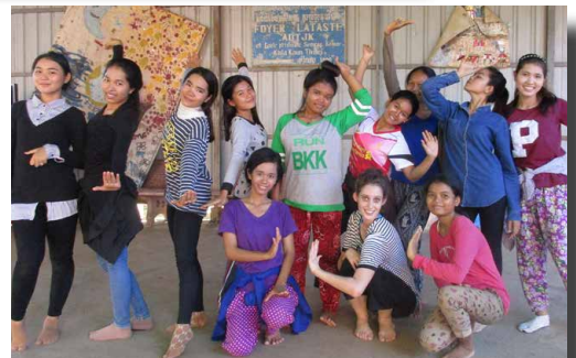
La belle team! Dernier cours de danse