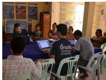
◀ Formation premiers secours pour les salariés (à gauche) et les jeunes (en dessous) ▶