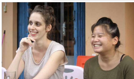
← Ancienne et nouvelle stagiaire autour de l’apéro entre collègues