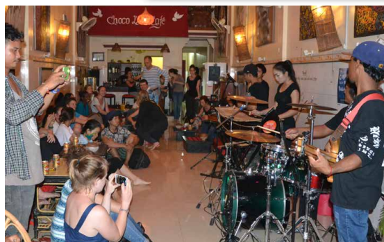
← Concert au Choco l’Art Café à Battambang