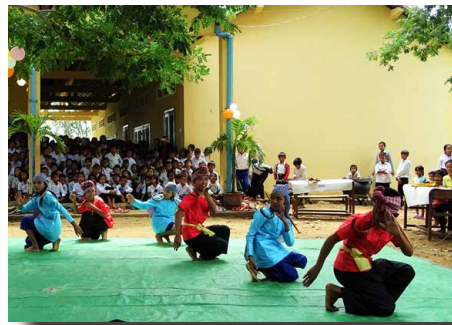
La troupe de danse khmère du Foyer nous dévoile la danse des moissons