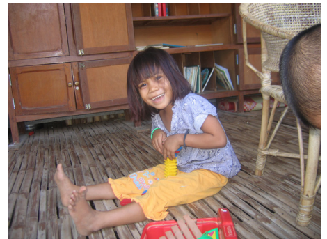
*Enquête sur les années 2014, 2015, 2016 et 2017 pour les lettres échangées dans le cadre du parrainage individuel entre les enfants au Cambodge et leurs parrains-marraines de France (programme FI, FA et MF).

Les parrains et marraines actuels ne verront aucun changement dans leur parrainage individuel sauf en ce qui concerne la distribution des cadeaux. Les évolutions des modalités de la correspondance ne concernent que les nouveaux parrainages individualisés : ceux des anciens parrains marraines souhaitant parrainer un nouvel enfant, ou encore pour les nouveaux parrains et marraines de l'association.