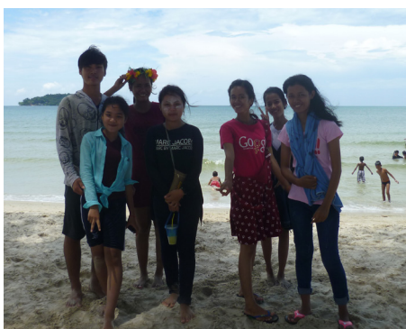
Sur la plage, à Kep.

Le troisième jour, ou « Thngai Laeung Saka », est celui de l'adoration ; il marque le début solennel dans la nouvelle année. C'est à cette occasion qu'a lieu la cérémonie du Pithy Sroang Preah qui clôt les festivités et qui permet de demander la bénédiction et la rédemption de ses péchés. Les fidèles nettoient les statues de Bouddha avec de l'eau parfumée : symbole de l'importance de l'eau, et moyen d'acquérir longévité, chance, bonheur et prospérité. C'est le moment aussi où les jeunes khmers aspergent les passants d'eau, un geste de bénédiction. On invite également les parents, patriarches, guru (maîtres, chapelains) à prendre un bain. Les enfants expriment leur gratitude, demandent le pardon pour les fautes commises et espèrent obtenir les meilleurs conseils pour le futur. Les bonzes sont mis à contribution pour présenter des vœux aux trois joyaux (le Bouddha, le Dharma, le Sangha) et aux ancêtres des parents.