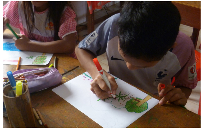
Atelier d'arts plastiques sur le thème de la nature.