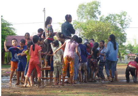
Jeux du nouvel an Khmer au Foyer Lataste.

Le deuxième jour, ou « Voreak Wanabat », est consacré à l'adoration et à la charité envers les moins fortunés. Cette journée consiste alors à offrir des cadeaux à la famille (parents, grands-parents, aînés), aux domestiques, aux sans-abris et aux foyers défavorisés. Les familles se rendent aussi dans les pagodes pour honorer leurs ancêtres, où elles confectionnent des montagnes de sable pour rechercher la bénédiction des religieux. Les khmers en profitent aussi pour jouer dans la rue à des jeux traditionnels comme le Boh Angkunh, le Chaol Chhoun, le Leak Kansaeng et le tir à la corde.