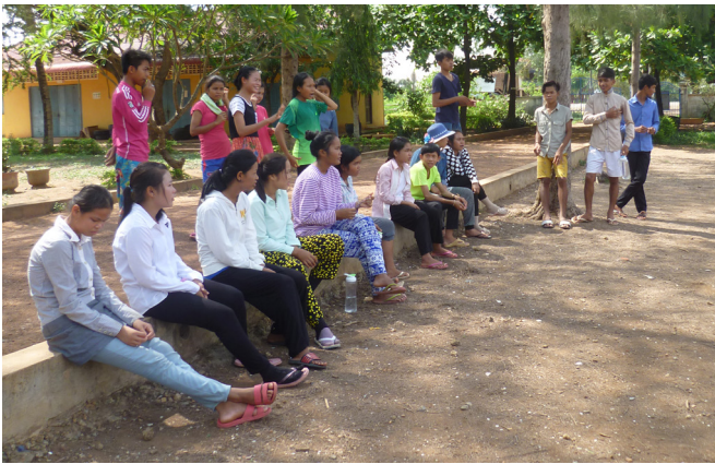
Sensibilisation sur la thématique des déchets.