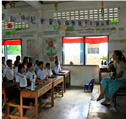
Musiques en anglais dans les salles de Somras Komar.