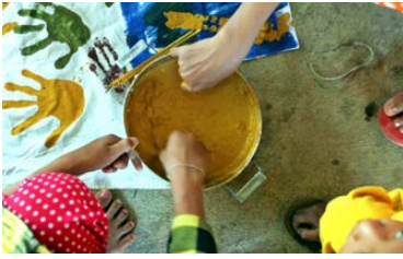
La folie des couleurs!