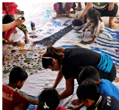
Création d'un panneau de décoration sur le thème «la beauté de la nature».

Novembre 2014, Barcelone: le sac à dos et la guitare à la main j'embarquai pour un voyage non-stop de deux jours pour le Cambodge, mon premier voyage en Asie ! La majorité de ses heures de trajet je les aient passées sur les routes, dans un bus entre Bangkok et Phnom Penh où m'attendait ma première mission de bénévole : faire un petit concert solo pendant le vernissage de l'exposition de photos et de poèmes de l'AEC-Foyer Lataste. Tout juste arrivée, cette belle soirée de l'ONG au centre Bophana me présentait une grande famille, réunie dans la bonne humeur dans un esprit de coopération et de partage.