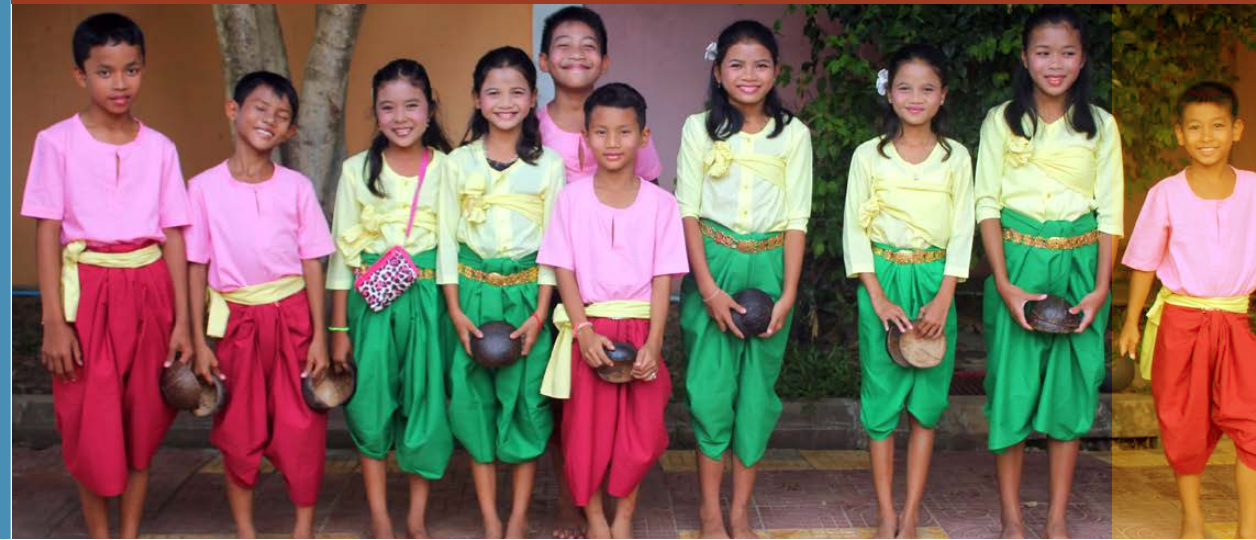
«La mémoire est un repère» Rithy Panh