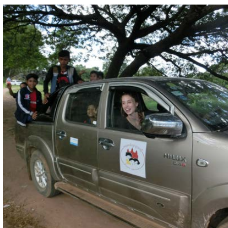
L'équipe de terrain amènent tous les enfants au temple: en voiture et en camion.