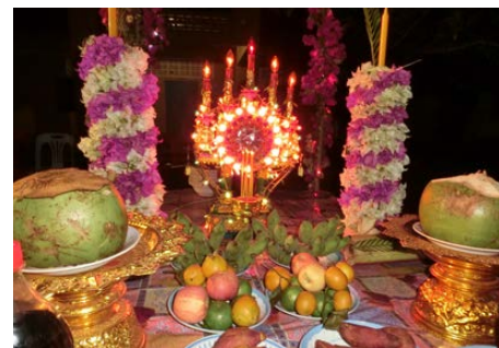
L'autel orné d'offrandes préparé pour la fête de la lune.

L'inauguration est marquée par une présentation de différentes variétés de danse khmère interprétées par les enfants du Foyer, des plus jeunes aux aînées. Après le repas festif partagé avec les enfants et tous les personnels du Foyer, la seconde partie de la soirée s'amorce autour d'un autel orné d'offrandes aux divinités, soigneusement préparé par les enfants avec l'aide de l'équipe khmère. Les enfants dansent, chantent et les adultes aussi. A la lueur de la pleine lune, qui symbolise en Asie la réunion familiale, nous étions tous comme une vraie famille. L'apogée de la soirée est une coutume cambodgienne propre à cette fête : manger une cuillerée de riz, suivie d'une bouchée de banane, et faire un vœu! Selon la croyance populaire cambodgienne, on peut ainsi réaliser un souhait. Non seulement les enfants mais aussi les adultes y participent. Avec la bouche pleine, les enfants prononcent leurs vœux devant le public : « Je veux devenir une fille intelligente », « je veux un vélo! » ... les vœux sont très variés. Quant aux adultes, leurs vœux se résument à un seul : que chaque enfant se réalise dans le bonheur et le bien-être.