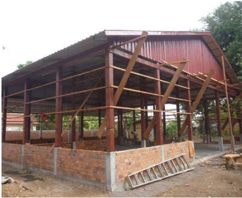
Avancées de la construction du bâtiment où seront accueillis les jeunes apprentis.