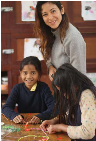
Dessin et apprentissage des techniques de bracelets brésiliens.