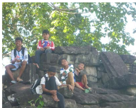
Les jeunes garçons du Foyer jouant dans les ruines.