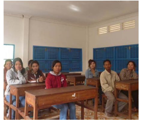
Réunion d'accueil des participants et leurs familles le 22 décembre 2014.

DÉBUT JANVIER, DÉBUTERA UN NOUVEAU PROGRAMME DE L'AEC-FOYER LATASTE QUI PERMETTRA À UNE DIZAINE DE JEUNES D'INTÉGRER UNE FORMATION PROFESSIONNELLE.