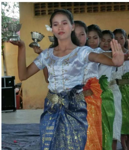
Spectacle de danse Apsara.