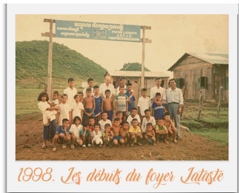
1998. Les débuts du foyer Lataste

Nous étions entourés par la forêt, le marché n'existait plus, les boutiques étaient vides, comme si le temps s'était arrêté. Les routes de terre étaient impraticables, notamment en saison des pluies où elles se transformaient en rivières de boue. Nous n'avions pas de voiture mais seulement deux petites motos et une charrette tirée par un cheval pour aller se ravitailler, emmener les enfants à l'école ou chercher du bois pour la cuisine. Nous n'avions aucun point d'eau, ni douche, ni toilettes... Nous devons aller chercher de l'eau potable en bouteille à quelques kilomètres. Par la suite, nous avons drainé un bassin. De cette manière nous faisons bouillir l'eau au bois pour la rendre buvable.