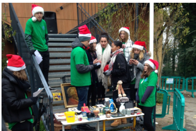
Marché de Noël organisé par le Collège Lycée Saint Louis Saint Clément.