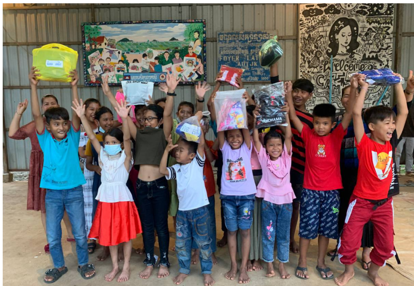
Fête de Pchum Ben au Foyer.

19 septembre : Atelier de réparation de vélos.