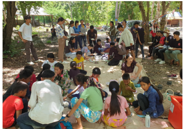
Sortie à Phnom Preah.

Depuis plusieurs mois, les opportunités de sortir du Foyer se font bien rares. La plupart des lieux touristiques sont fermés ainsi que la majeure partie des lieux extérieurs (parcs, temples, ...). Mais nous avons trouvé un petit coin de nature, au calme, et loin de tout, pour aller passer une belle journée ensoleillée. Après une petite heure de route en camion, nous voilà arrivés à Phnom Preah, qui signifie « la montagne sacrée ». Les plus aventureux sont partis en exploration au sommet de la montagne, tandis que d'autres profitaient de la forêt des alentours pour jouer et construire des cabanes. Tout le monde s'est réuni pour pique-niquer : poissons et riz étaient au menu. Une belle journée qui a permis à tous de prendre l'air et de s'amuser en pleine nature !