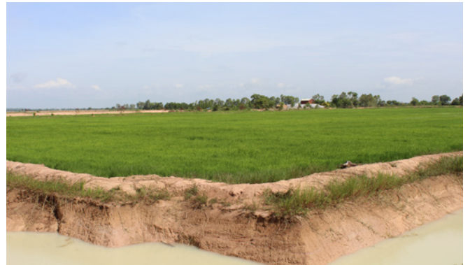
La rizière semée

Depuis les dernières nouvelles que nous vous donnions, notre rizière, a été soigneusement labourée et semée. Nous espérons prochainement obtenir les premières pousses de riz !