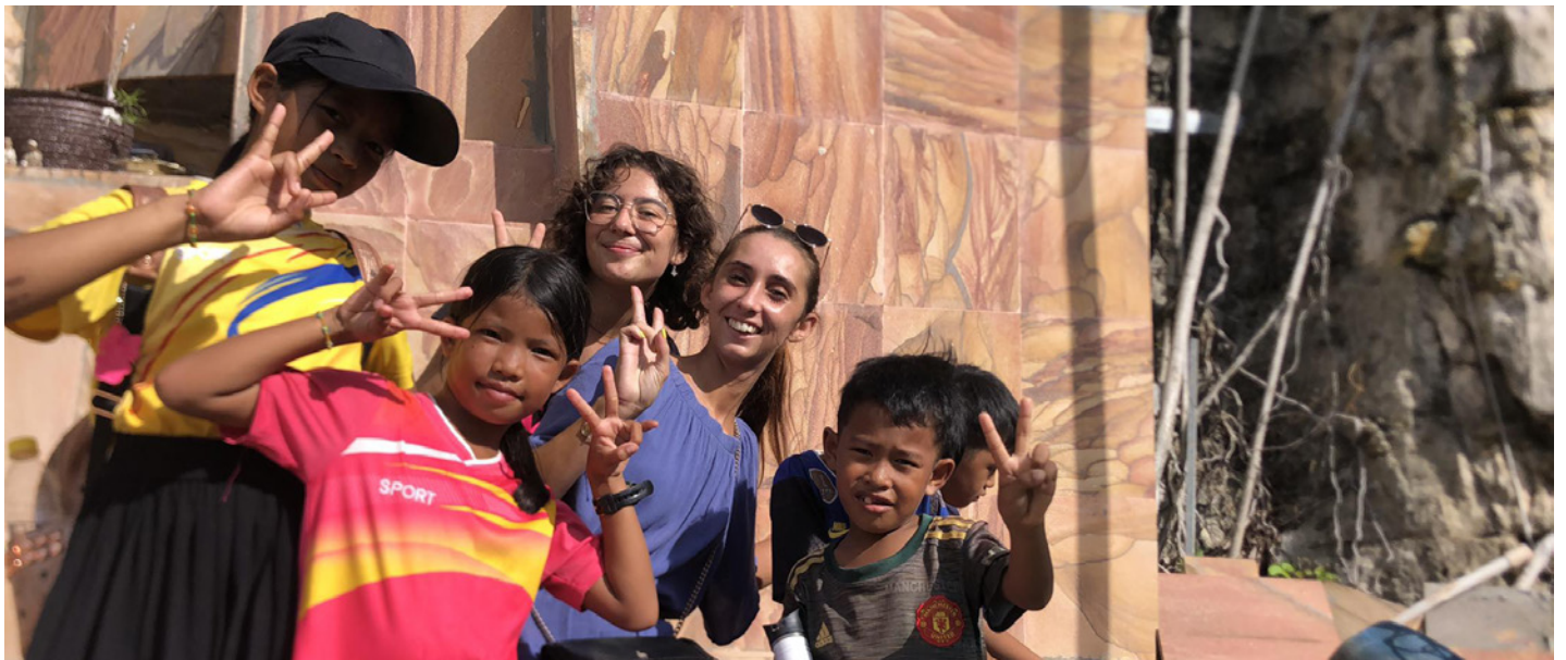
Sortie du dimanche avec les enfants du Foyer

27 septembre : Visite des grade 11 et 12 à Siem Reap pour orientation scolaire.