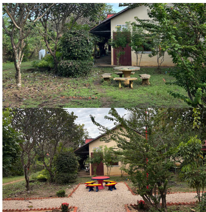
Avant/Après du jardin

Tout au long du séjour, des activités ont été organisées les après-midis ainsi que sur certaines journées entières, afin de renforcer les liens créés durant le chantier. Ces temps partagés ont permis aux enfants de vivre ensemble des moments de découverte et de convivialité. Au programme : visites des villes de Sisophon et de Battambang, découverte des temples d'Angkor et de l'écoferme. De grands jeux ont également été organisés au sein du foyer.