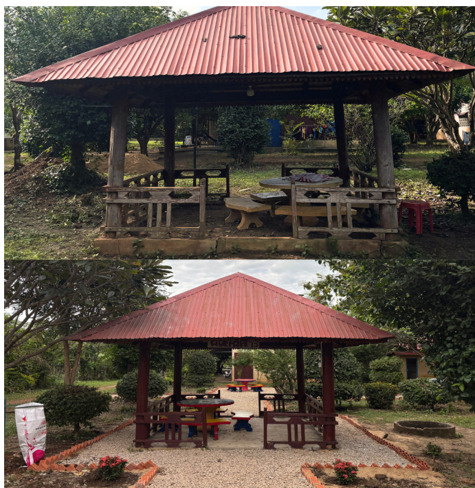
Avant/Après du kiosque

Ensemble, les enfants ont entrepris la réhabilitation d'un kiosque. Après un important nettoyage, ils ont appris à poser une dalle au sol, à peindre le bois, à installer un ventilateur ainsi qu'un éclairage. Autour du kiosque, les enfants ont également aménagé les abords en créant des chemins de cailloux et en plantant des fleurs. Un peu plus loin, un jardin a vu le jour avec la plantation d'arbres fruitiers, dont les récoltes profiteront aux enfants du foyer dans les années à venir.