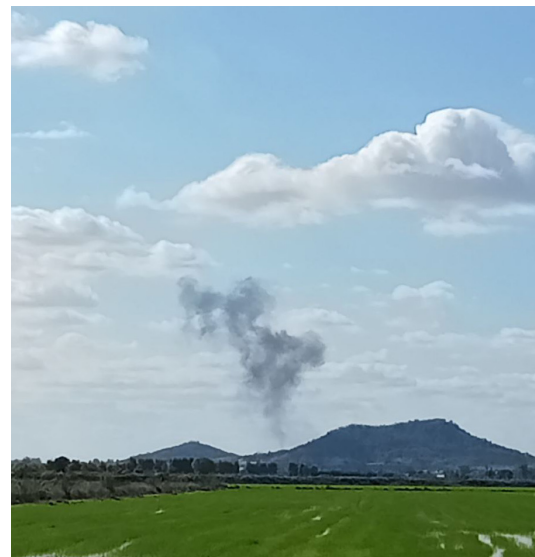
Photo prise du foyer Lataste depuis la montagne de Kongva, suite à six tirs de F-16 le 27 décembre.

Malgré cette trêve, la situation reste fragile, les causes profondes du conflit liées au tracé de la frontière et à des rivalités historiques — n'ayant pas été pleinement résolues.