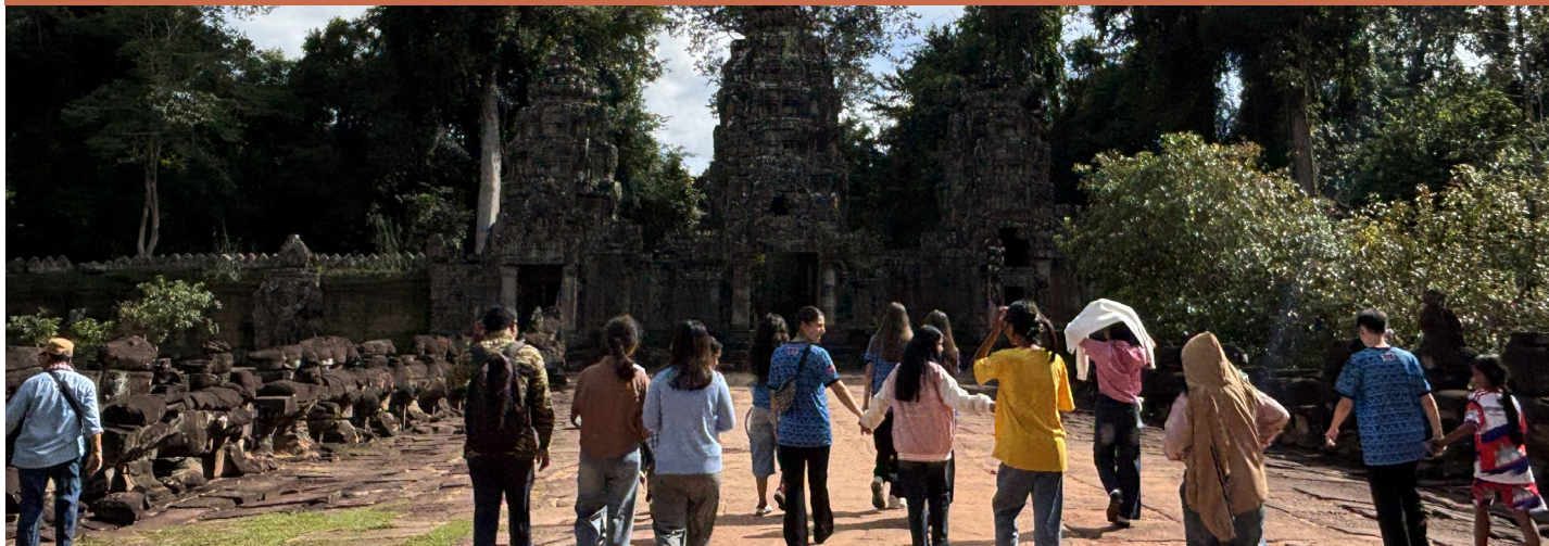
Visite des temples d'Angkor

C'était une expérience totalement nouvelle pour eux. C'était la première fois qu'ils voyageaient aussi loin. Ils ont découvert le sud du Cambodge, les nuits à l'hôtel ainsi que les plantations de Kampot, ce qui a été très marquant et enrichissant pour tous. Ce séjour a également permis de renforcer les liens. Il a été rythmé par des moments de partage intenses et de nombreux rires sur plusieurs jours d'affilée.