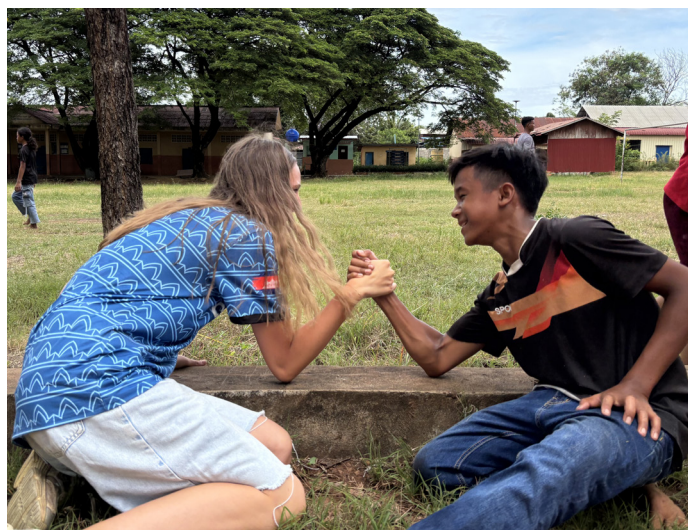
Jeux et partage entre les enfants du foyer et ADEPAPE13