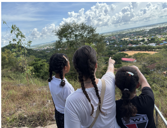
Visite guidée de Sisophon par les enfants du Foyer à ADEPAPE13